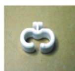
Suporte da Colher