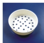
Bandeja de Cozer verduras